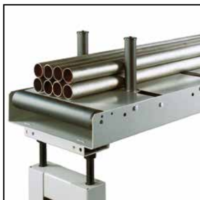
Pareja de rodillos verticales (Opcional)

Mesa de descarga de rodillos con varilla milimétrica y tope de medida, elemento siguiente, longitud 2 m, capacidad 600kg.