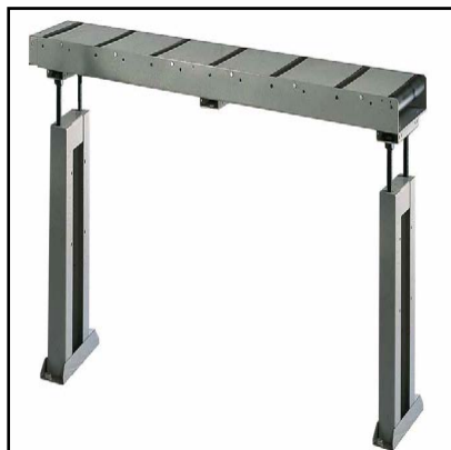
Mesa de rodillos para lado de carga/descarga (Opcional)