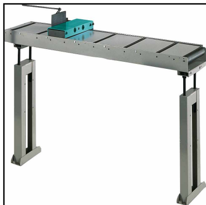
Mesa de rodillos de descarga (Opcional)

Mesa de descarga de rodillos con varilla milimétrica y tope de medida. 1er elemento longitud 2 m, capacidad 70