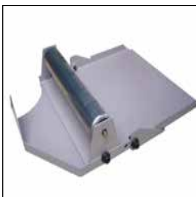
Collegamento con rulliera per il lato di scarico (Optional)

Elemento di collegamento tra rulliera per il lato di carico e la macchina.