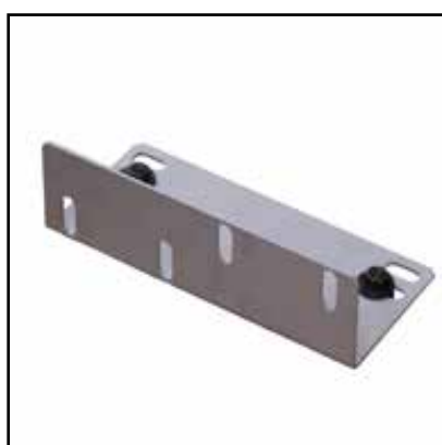
Collegamento per piano a rulli (Optional)

Elemento di sostegno regolabile in altezza da 710 a 1100mm. Larghezza 260mm, portata 150kg