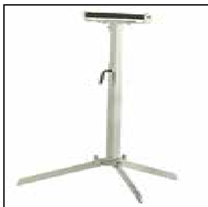
Sostegno porta-barre (Optional)